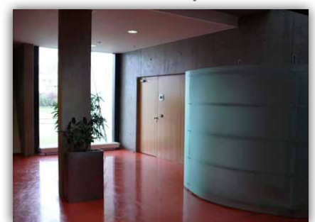
místo 5, 6